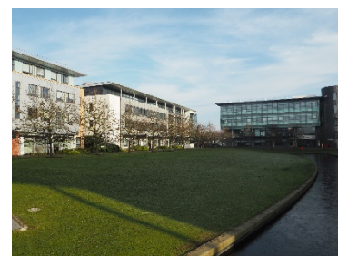
ウォーリック大キャンパスの様子

大学の特徴：イングランド中西部のコヴェントリーに位置する総合大学。学生数は 17,755 名（学部生 1,2675 名、大学院生 5,080 名）。留学生の割合は 27.7%。※Good University Guide より。