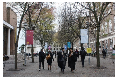
SOAS キャンパスの様子

Applied linguistics/Head, Departments of the Languages and Cultures of Japan and Korea