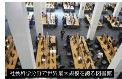
社会科学分野で世界最大規模を誇る図書館

世界に燦然と輝く社会科学系の研究型大学。THE世界大学ランキング（2014～2015）では34位（英国内5位）、同年のTHE分野別世界大学ランキング＜社会科学分野＞で11位（同3位）、QS分野別世界大学ランキングでも経済、政治・国際関係等の9分野で8位以内に輝いている。また、英国の大学研究評価（REF）2014でも、全体値で社会科学系を中心に研究の50%が世界トップレベル、37%が世界レベルという極めて高い評価を受けている。