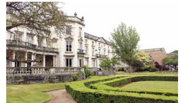
Digby Stuart College キャンパス

学位は主にモジュラー制を採用している。これは各モジュール（コース）を履修し単位を取得して徐々に積み上げていく方法で、十分な単位数に達した時点で卒業する制度である。この制度によって、コース選択の幅は格段に広がり、途