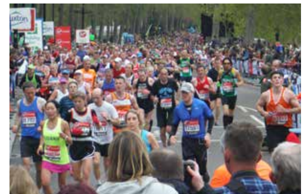
誰のために走る？ランナー選