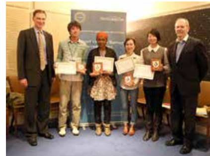
RENKEI スプリング・スクール “District Energy Supply within Cities” (2015年3月)

RENKEI (Japan-UK Research and Education Network for Knowledge Economy Initiatives) は、2012年3月