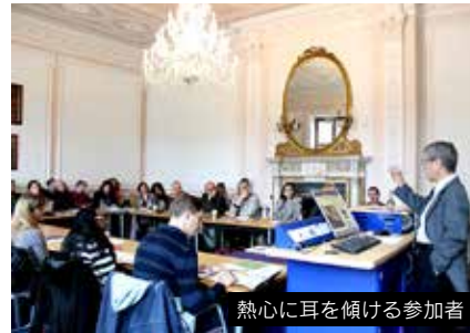
熱心に耳を傾ける参加者

同大学はロンドン中心部から公共交通機関で30分でアクセス可能な好立地に加えて、54エーカー（約66,000坪）の広大