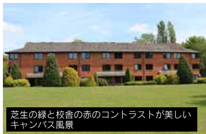
芝生の緑と校舎の赤のコントラストが美しいキャンパス風景

ロンドンから北西へ電車・バスで約1時間半のキャンパスにはレンガ造の校舎が整然と立ち並び、青々とした芝生と木々が美しく、校内を流れる小川からはせせらぎの音が聞こえる。学生には静かで落ち着いた学習環境が用意されている。