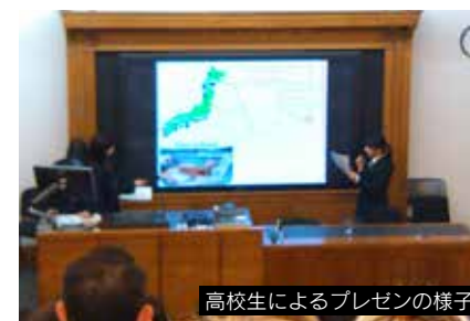
高校生によるプレゼンの様子

1つ目のイベントは「東日本大震災後の福島再生」というシンポジウムで、福島県の内堀雅雄知事のスピーチから始まって、福島県の高校生が、震災前後の生活の変化や、放射性物質測定の研究結果について流暢な英語でプレゼンを行った。福島と海外各国の協力校の高校生達が日常生活圏内の放射性物質を測定した結果、福島と他の国とで有意な差はなかった、というサイエンティフィックな発表表に、日英の多くの聴衆が感銘を受けた。