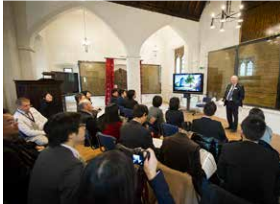
第6回英国大学視察訪問（2014年11月）