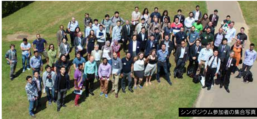
シンポジウム参加者の集合写真

2015年7月9日、10日の2日間にわたり、Southampton大学において、UK-Japan Silicon Nanoelectronics and Nanotechnology Symposium in Southamptonが開催された。本会議は、情報通信産業のみならず、環境、医療、エネルギー産業等でも中核を担い続けるシリコンナノエレクトロニクス・ナノテクノロジー分野で活躍する日英のトップ研究者が、英国随一の研究用クリーンルーム設備を有する本学に集い、議論、情報交換を通じて、この分